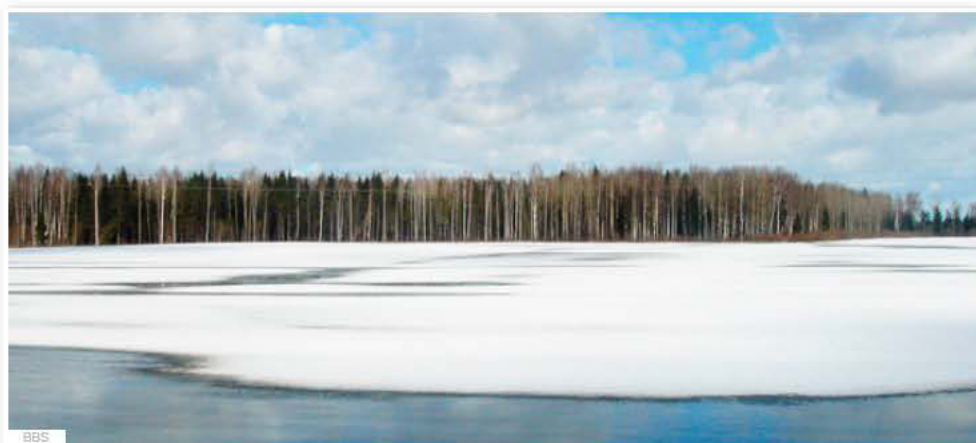
Projet de parc autour du nouveau Musée National estonien, à Tartu, sur une ancienne base aérienne russe.