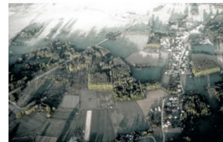
Het landschap van Vlaanderen is gekenmerkt door fragmentatie van de verschillende elementen.

Meer dan het uittekenen van de verkavelingen zou het goed zijn dat iedere stad ook een stedelijk landschap laat ontwerpen, als tegenvorm van deze verkavelingen. Het is misschien een utopie, maar eigenlijk zou elke stad of regio een structureel landschap moeten laten uittekenen en realiseren. Dan maakt de eigenlijke vorm van de verkaveling minder uit.