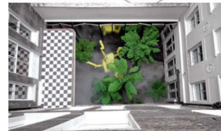
De klimatologische condities van deze verdiepte binnenkoer zijn gelijkaardig aan die van een subtropisch onderbos.