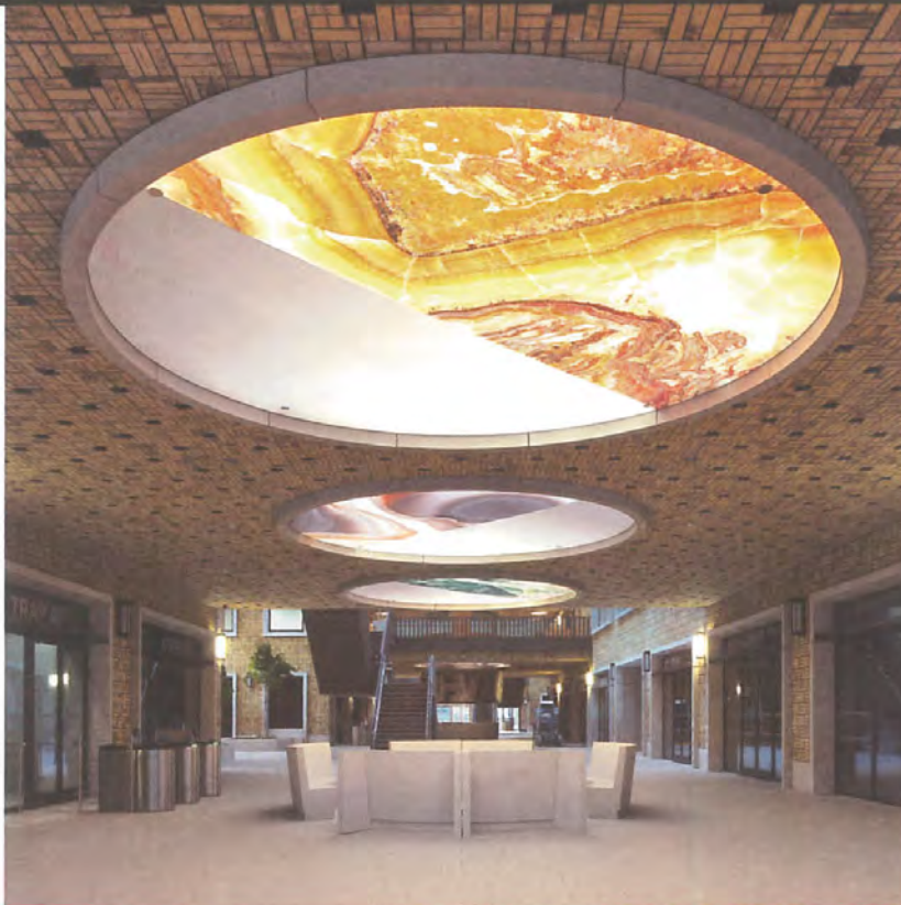
Nevelings Riedijk Architects