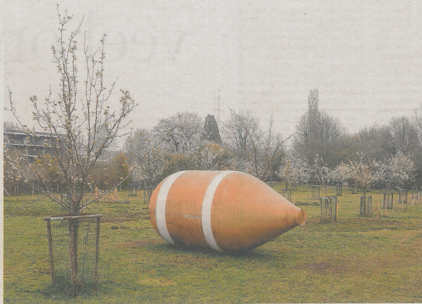
Landinzicht knipoogt naar Bruegels 'Kinderspelen' met speeltuigen uit het hedendaagse boerenbedrijf.