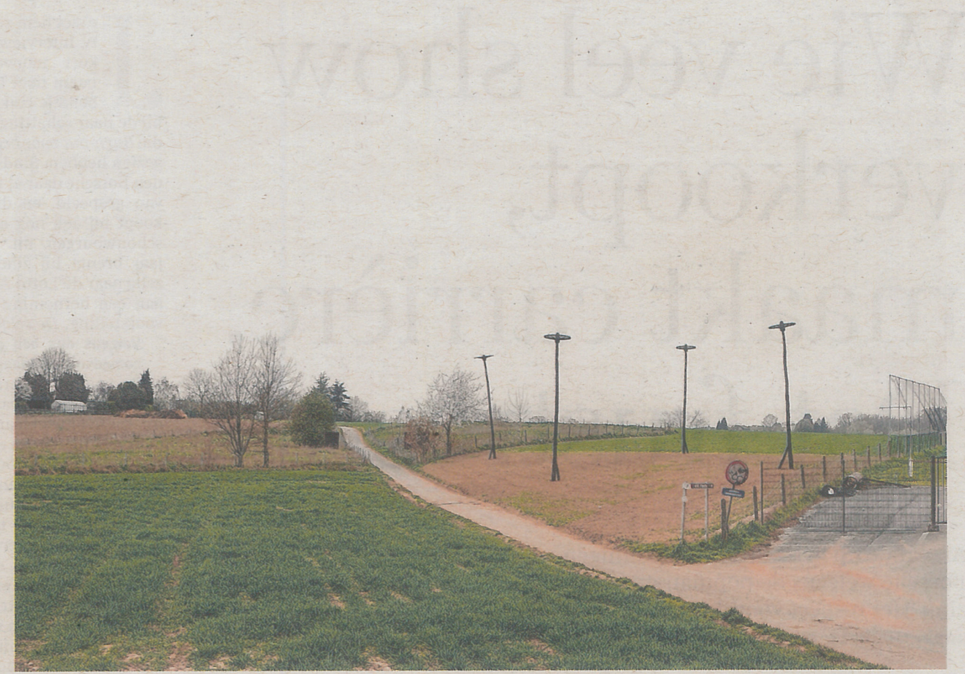
Bas Smets plantte vier radpalen neer, laatmiddeleeuwse marteltuigen.