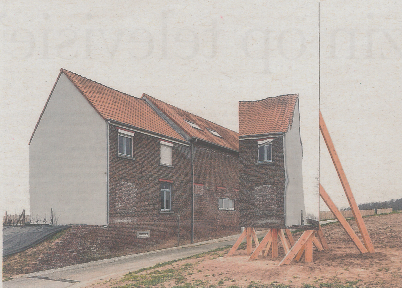
Filip Dujardin accentueert de banaliteit van de bebouwde omgeving met een spiegel.