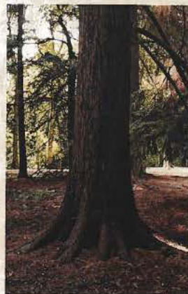
Douglaspar uit Oregon.

'Landschapsarchitectuur is niet: ik heb een beeld voor ogen en hoe ga ik dat nu eens maken? Het is: waar ben ik? Wat is hier al allemaal? Wat zou de natuur doen? Elke site evolueert naar een natuurlijke climax. Het is mogelijk om in te schatten hoe een plek er over tweehonderd jaar zal uitzien. We proberen dus op een judo-achtige manier de kracht die er al is onze kant op te trekken. Het is mogelijk om daar knal tegenin te gaan, maar dat vraagt veel werk. Wil je thuis een perfecte gazon, dan moet je bemesten, verticuteren, maaien en water geven. Dat is niet wat de natuur wil doen. Ecologisch hebben gazons geen enkel nut. Integendeel. Ei-