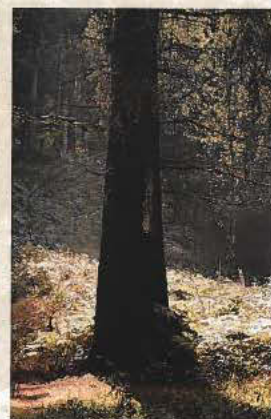
Mammoetboom uit Noord-California.

genlijk zou het een regel moeten zijn dat iedereen de helft teruggeeft aan de natuur. Die weet zelf het best hoe hij een plek moet begroenen. Dat principe proberen wij in onze grote projecten toe te passen.'