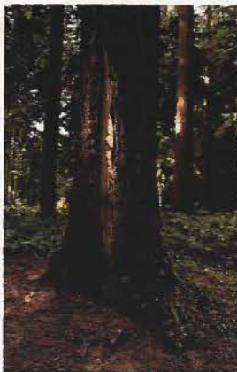
Hemlockspar out Alaska.