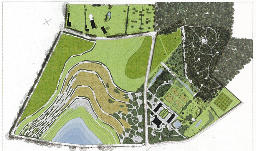
Plan du Château de Padiès.

Bas Smets : Quand j'avais dix huit ans, j'ai vécu une année dans un petit village aux Etats-Unis dans le cadre d'un échange interculturel. Le manque d'espace public m'avait profondément marqué. Je n'arrêtais pas de fuir vers la ville, seul lieu où je me sentais libre.