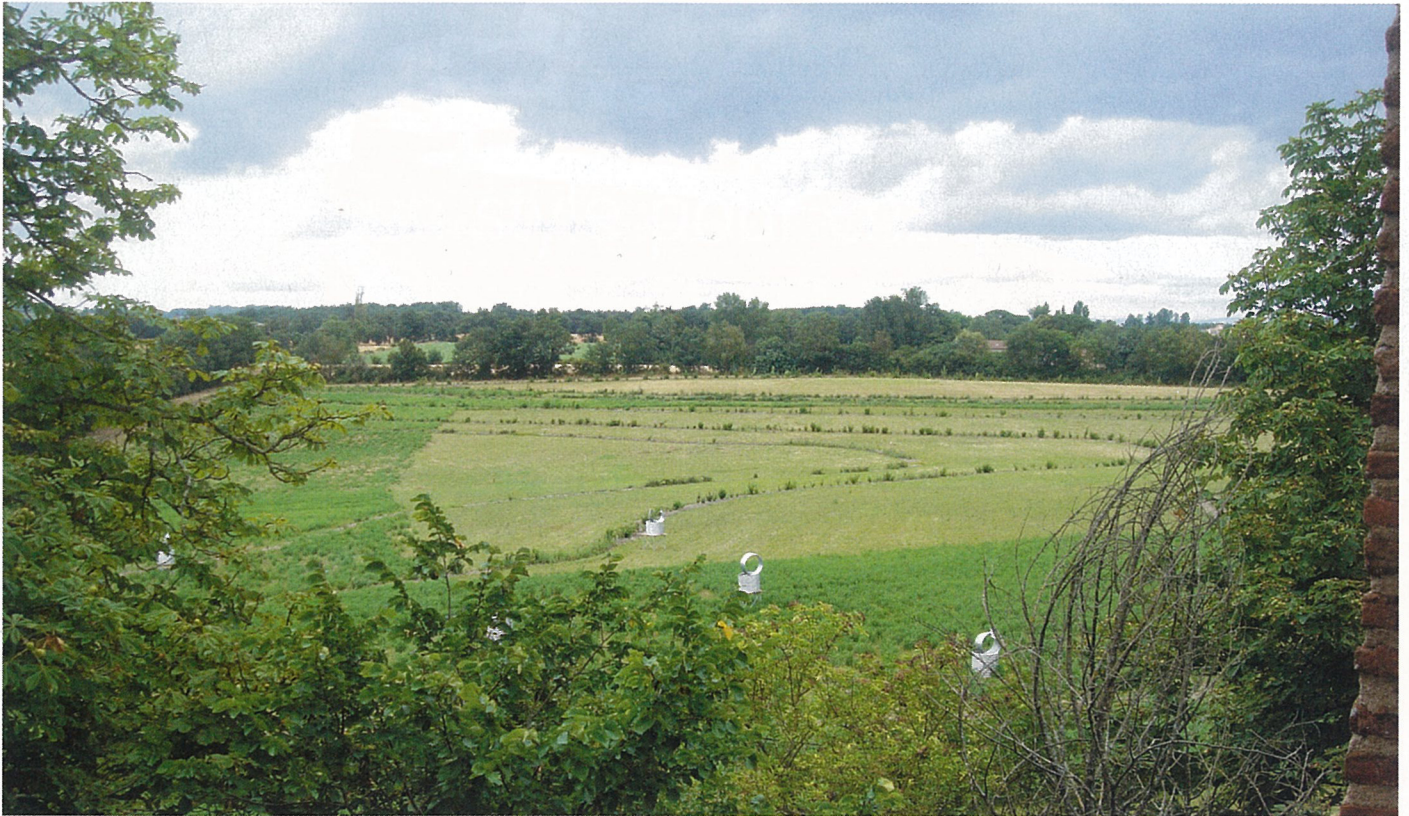
Transformation d'un domaine historique de 15ha en parc public.